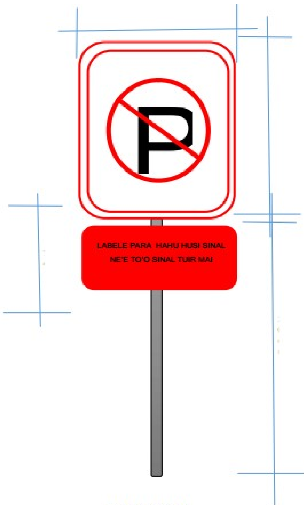
SINAL DE PROIBICAO ESTACIONAMENTO